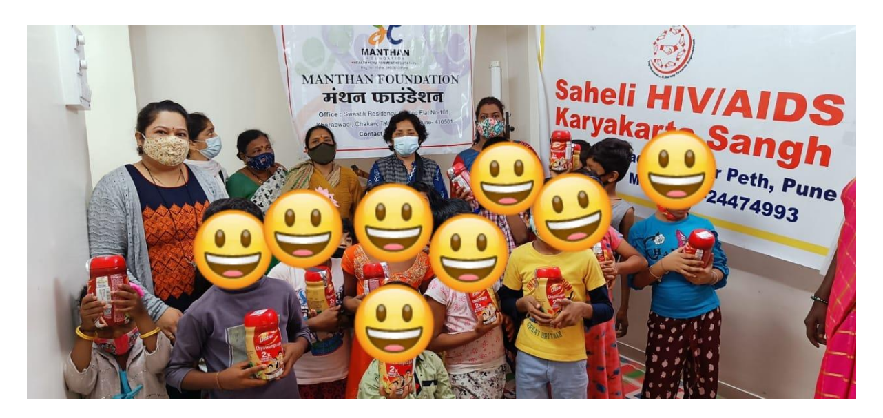
Distributed 'Chavanparsh' to children of Female Sex Workers at Budhwarpeth, Pune