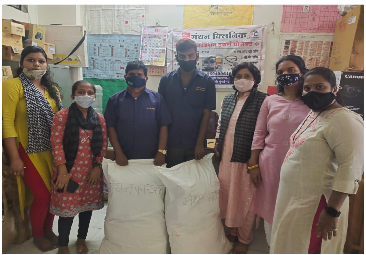
Distributed Nutrition to the female loaded and unloaded allied population at APMC market.